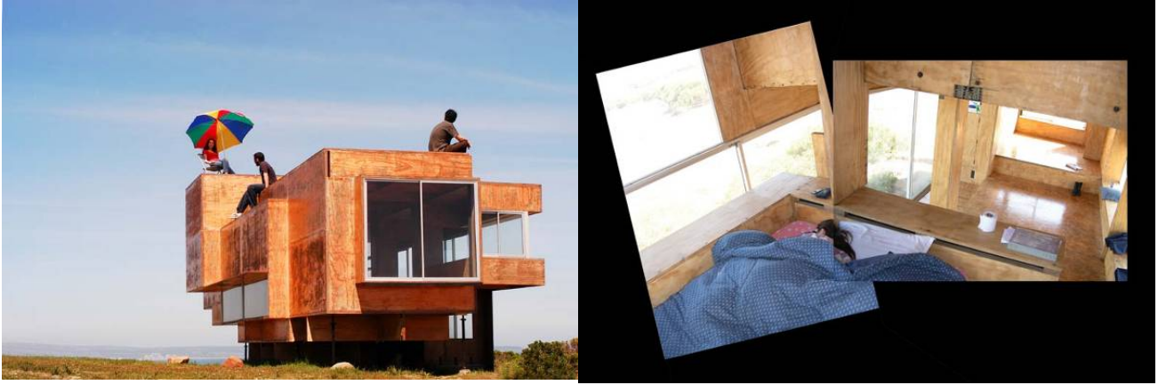
Resim 8/ SISTEMA M7 TUNQUEN COOPERATIVA URO1.

Şilili mimarların İspanya'da yaptığı ucuz konut çalışması (resim 8)