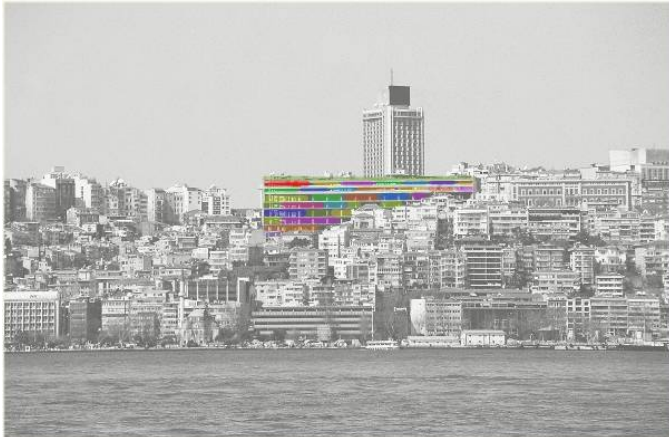
Resim 3/ park otel'in kentle entegrasyonu

Bu bağlamda bu düşüncelerimizi konuşurken 3 mimar bir araya gelip, bunlar üzerine biraz fikir ürettik. Tartışmalarımızdan önce çeşitli fikirlerimizi projelendirdik ve bu projeler üzerinden fikirlerimizi çarpıştırdık. Bu tartışma ve projeler 3 ay önce İstanbul dergisi’nde yayınlandı. “Bu alanın mevcut haliyle yok sayılmadan nasıl kent peyzajının içinde kamusal mekana açılabilir?” sorusuna odaklanarak durumu ve mimar olarak konumumuzu sorguladık. (resim-3,resim4,resim 5)