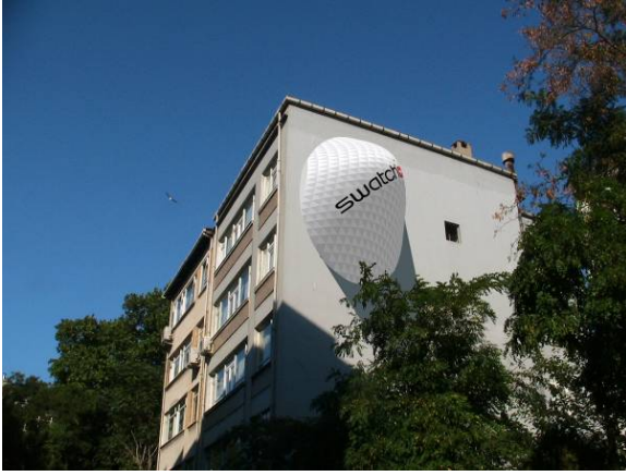
Resim 1/ kent göçebeleri

Ben de proje de bu duruma odaklanarak, bu şekilde kullanılan 3. boyutta asılı kalan kent mekanı, acaba zamanı ve çalışma biçimini farklı şekillerde kullanan, kentte göçebe olarak hareket eden bir insan için barınma olasılığı yaratabilir mi? sorusunu soruyorum. Bu proje aynı zamanda ‘bu rant ve ticari durumların kendi olanaklarını da kullanıp onları yok saymadan, kendi problemi içine katabilir mi? nin başka türlü bir araştırması. Bir iç modül ve bir kabuktan oluşuyor ve yerleştiği yüzeyin altyapı ve olanaklarını kullanıyor. Bulunduğu alandaki imar durumu değişikliği, ya da yeniden yapılanma esnasında, tıpkı kullanıcıları gibi göçebe olarak taşınıp, varolabileceği yeni bir yer buluyor kendisine... Bu proje, kentte mülkiyet derdi olmadan yaşama olanaklarınının da bir araştırması olarak da kavranabilir. (resim-1,resim-2)