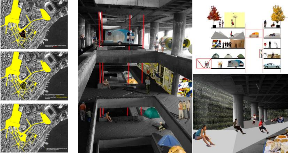
Resim 4-5/ park otel'in kente entegrasyonu

Bizde genelde bu tür sorgulamalar projeler üzerinden ya da üretilen üretimler üzerinden tartışılmaz. Karmaşık konulara giren, aslında mimarlık alanının da dışına çıkan, bazen tamamen mimarın sosyolog gibi konuştuğu, kendi tasarım araçları üzerinden düşüncelerini üretmediği söz üretimine dönüşür. Böyle olduğu sürece de hiçbir zaman bir yerlere oturmaz ve bir zemin üzerine kurulamaz. Özellikle bugünün kent yaşamı üzerinde düşünülecek ve kafa yorulacak çok konu olduğunu düşünüyorum.