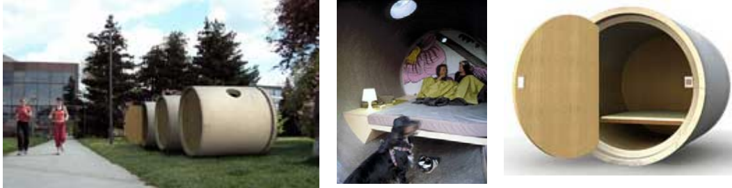
Resim 9/Das Park Hotel

Avusturyalı mimarların, beton silindir kanallarla gerçekleştirdikleri otel (resim 9)