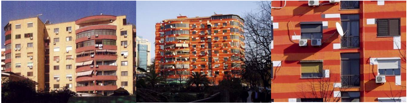
Resim 6/ bolles&wilson

İki Alman mimarın Arnavutluk-Tiran'da gerçekleştirdiği cephe çalışması, (resim 6)