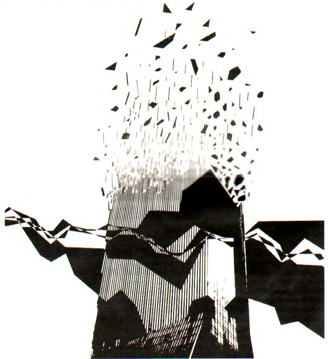
ILLUSTRASYON Orhan Kolukisa

Yukarıdaki "yeşil dünya" tablosunun mimarlık ortamımız açısından en görünür konularından biri olacağı kuşkusuz. Ancak bu noktada, mimarlık ortamındaki olası